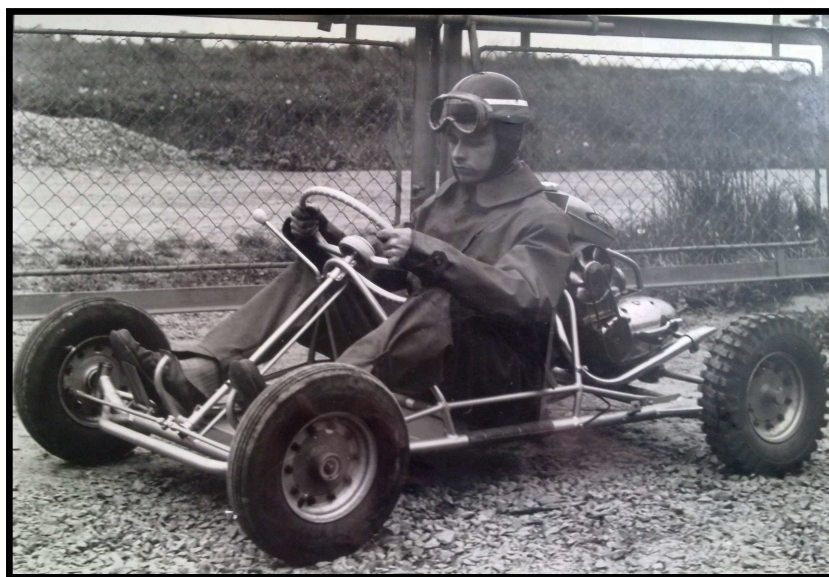
Pan Pardubický na fotografii z roku 1966

Ale není projekt, na který bych vzpomínal nejradši, pro mě to byla pokaždé hra, kterou jsem hrál rád. A všechno nové bylo zajímavé zase novým způsobem.